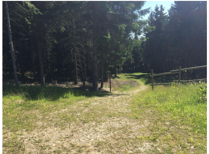
Auf Pfaden bergauf