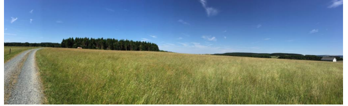
Hochfläche nahe Rauher Busch