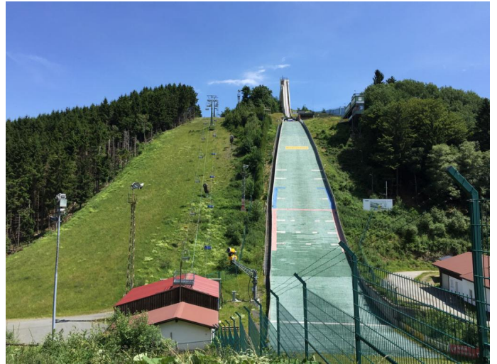
Blick vom Auslauf aus die St. Georg Schanze