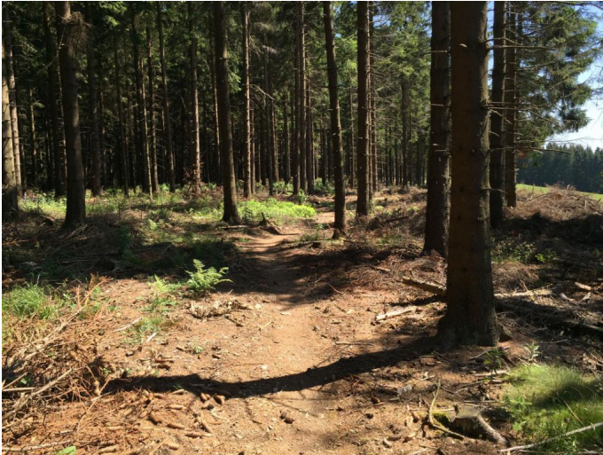
Oberer Sürenberg-Trail