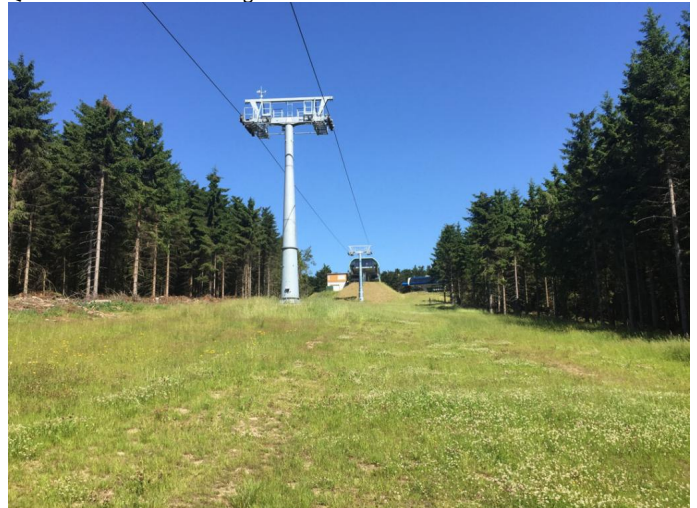
Blick auf Bergstation Schneewittchenhang