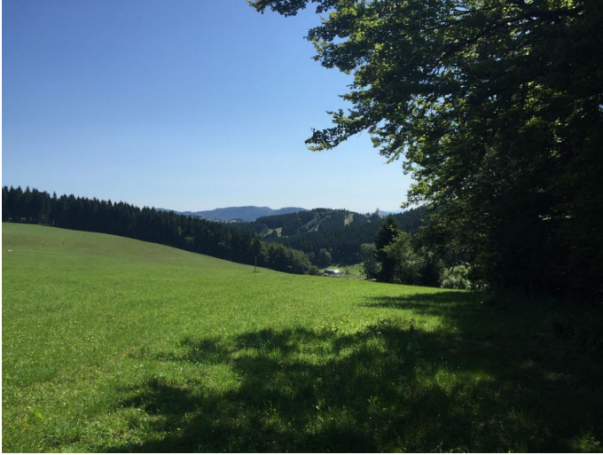
Blick vom Sürenberg auf die St. Georg Schanze Autor Daniel Fischer Quelle Ferienwelt Winterberg