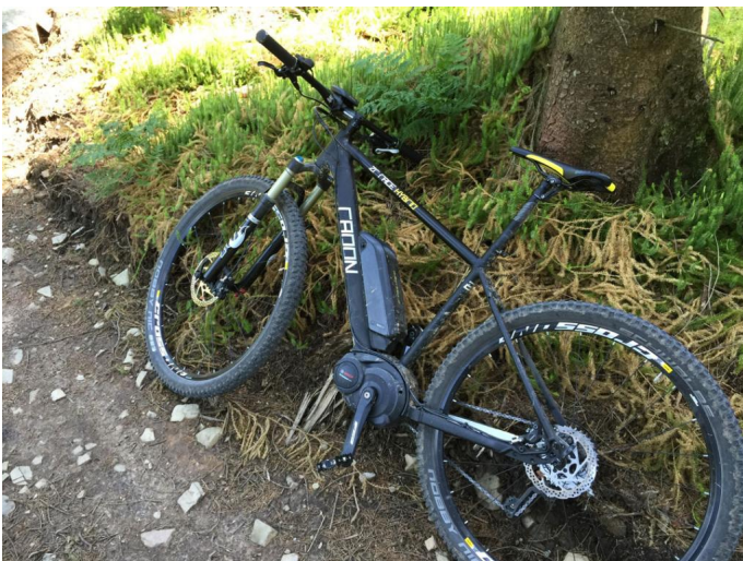
Kurze Pause