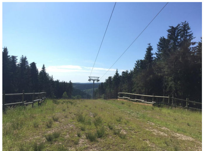
Blick bergab Schneewittchenhang